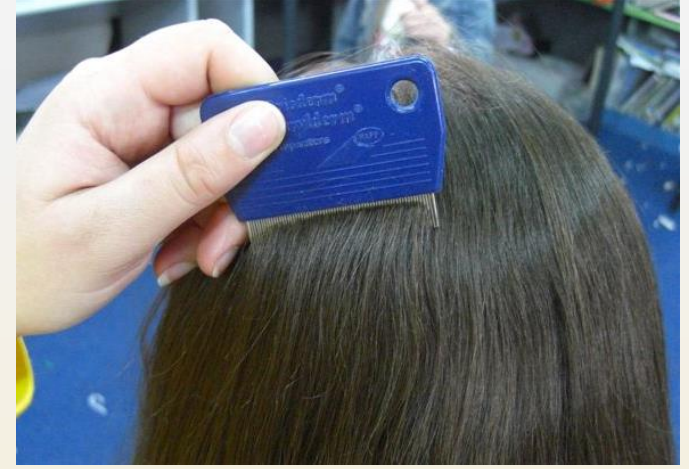
Bit tarağı ile saçların incelenmesi