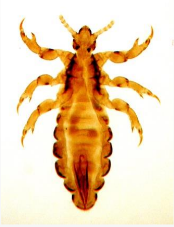
Baş biti (erkek)

Saç bitleri, sadece insan kanıyla beslenen 1-3 mm uzunluğundaki ektoparazitlerdir. Doğrudan kafa kafaya temas bitlerin en önemli bulaş yoludur. Tarak, fırça, havlu ve şapka paylaşımının bit bulaşındaki önemi düşüktür. 4-13 yaş arası çocuklar ve anneler en çok bit bulaşan gruplardır.