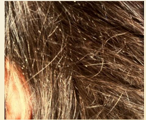
Saçtaki sirkeler (baş biti yumurtası kabukları)